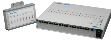
Model 5820 Ionizer Monitoring System